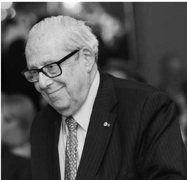
Victor Goldbloom

En 1990, après un mandat de sept ans, le commissaire Fortier est remplacé par Victor Goldbloom, le premier Québécois d'expression anglaise – et toujours le seul à ce jour – à assumer les fonctions de commissaire. Victor Goldbloom, originaire de Montréal, va encore plus loin que son prédécesseur dans sa critique de la politique linguistique du Québec. Dans ses rapports annuels, il déclare aussi publiquement s'être rendu à Québec pour tenter de convaincre les élus d'abroger la loi 178. Ancien ministre du Cabinet du Québec dans les années 1970 et parfaitement bilingue, M. Goldbloom a la réputation d'être un francophile et ses interventions ne sont donc pas accueillies comme étant une attaque contre le français.