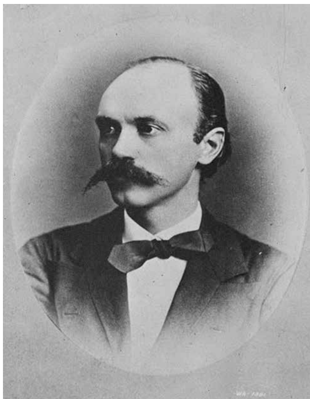
Calixa Lavallée

Pour montrer à quel point le Blackface était «normal» dans la province, Calixa Lavallée, le compositeur d' Ô Canada , a passé des années dans des troupes de ménestrels Blackface américains et s'est produit à Québec et à Montréal. Calixa s'était ouvert à d'autres formes de représentation, mais aux États-Unis, les Noirs qui étaient attirés par la musique n'avaient souvent pas d'autre forme de musique dans laquelle ils pouvaient se produire. Ainsi, dans les années 1880, les Afro-Américains ont soit créé leur propre ménestrel, soit rejoint les troupes blanches — ce qui n'était pas le cas à Montréal.