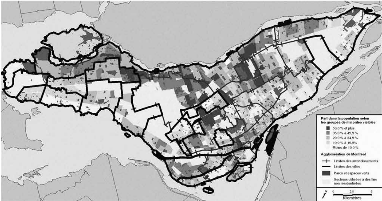
FIGURE 1 : CONCENTRATION DES PERSONNES APPARTENANT AU GROUPE DES MINORITÉS VISIBLES (2011)