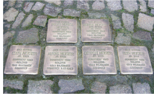
Stolpersteine de la famille Meister, Leipzig, Allemagne

Au cours des trois dernières années, nos événements phares, notamment la Journée internationale de la mémoire de l'Holocauste, célébrée le 27 janvier, et le Yom HaShoah, organisé chaque année en avril ou mai, ont été les événements clés au Monument national de l'Holocauste. Le Comité du Monument national de l'Holocauste se donne pour mission d'honorer les survivants, de rendre hommage aux millions de vies perdues et à éduquer les générations futures sur l'Holocauste. Grâce à l'éducation, à la mémoire et à la diffusion des faits historiques, nous pouvons témoigner notre