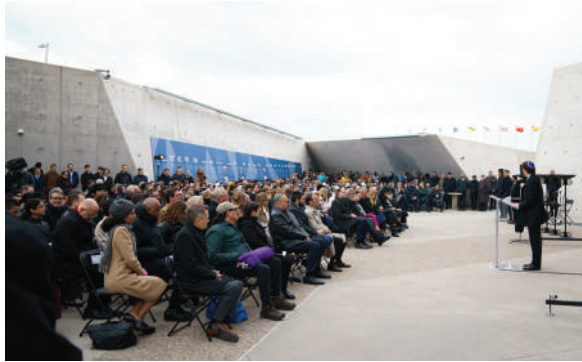
Monument national de l'Holocauste, Yom Hashoah, 2023

« Le Monument national de l'Holocauste, à Ottawa, a été inauguré par le Premier ministre du Canada, le très honorable Justin Trudeau, en 2017 et est depuis devenu un point de repère important dans notre pays. »